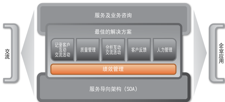
NICE SmartCenter 解决方案